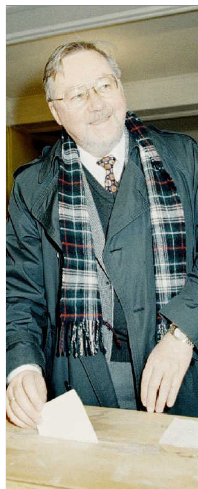
Litauen: Vytautas Landsbergis