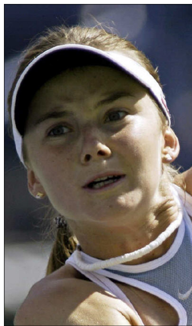
Slowakei: Daniela Hantuchova