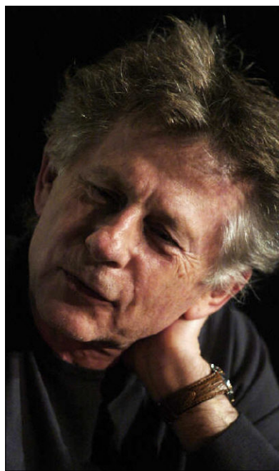
Polen: Roman Polanski