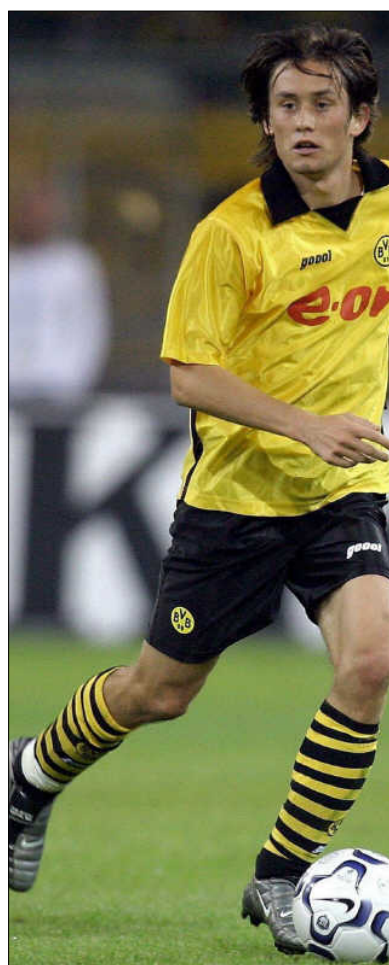
Tschechien: Tomas Rosicky

Um Unternehmen mit Rat und Tat zur Seite zu stehen bietet CCCaT hochqualitative Dienstleistungen, um diese Geschäfte zu erleichtern. Informieren Sie sich und buchen Sie unsere Dienstleistungen online auf www.cccat.com